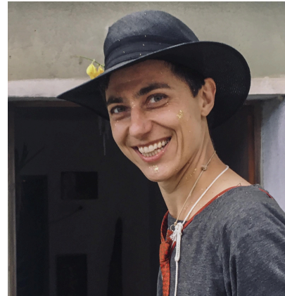
(c) petra rautenstrauch

Salon für Bildsprachlichkeit 1160 Wien, paNikengasse 29/6 heidrunkocher@gmx.at @heidrun_kocherkocher 0699/81205078